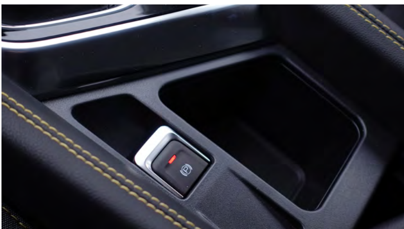
Elektryczny hamulec postojowy