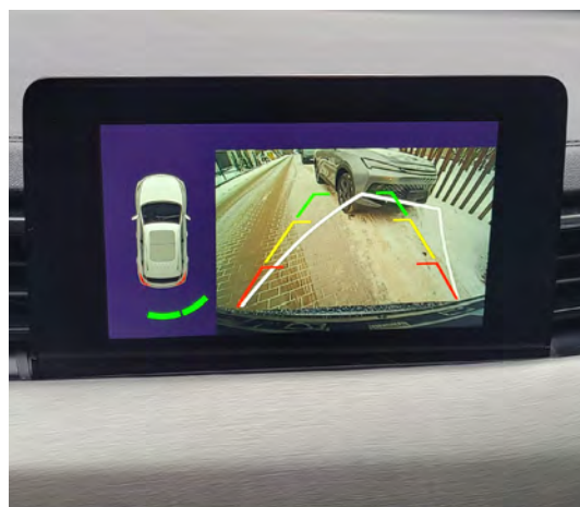
Kamera cofania z dynamicznymi liniami pomocniczymi