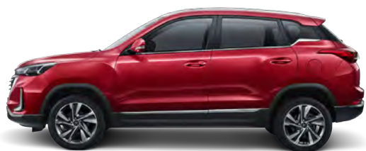
Czerwony metalizowany (BAQ)