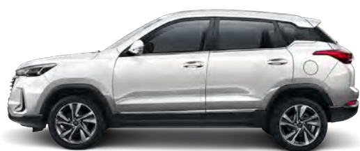
Biały perłowy (CAQ)