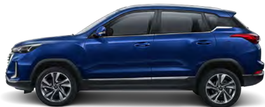
Niebieski metalizowany (EAT)