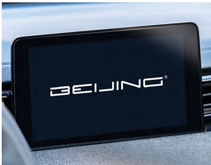
8-calowy multimedialny ekran dotykowy